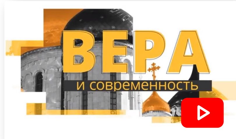
Православная реабилитация наркозависимых и алкоголиков "Здоровый Регион - 65"