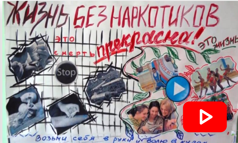
Реабилитационный центр продолжает свою работу