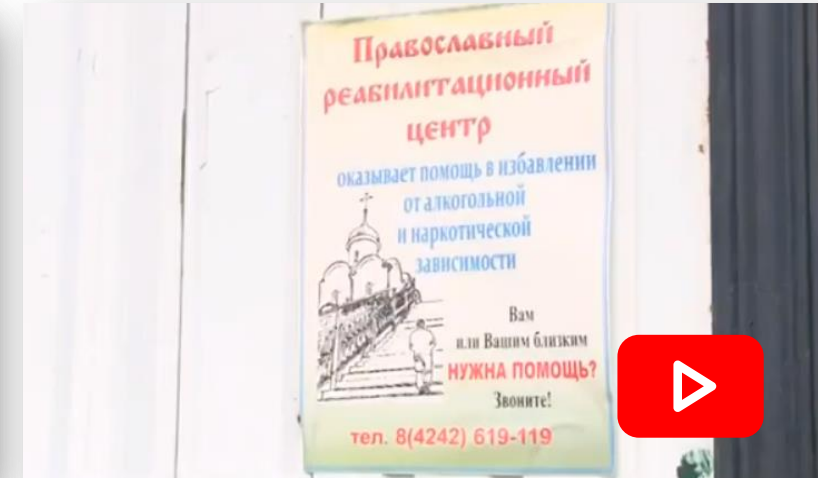
«Здоровый Регион 65». Реабилитация алкоголиков и наркоманов, Сахалин